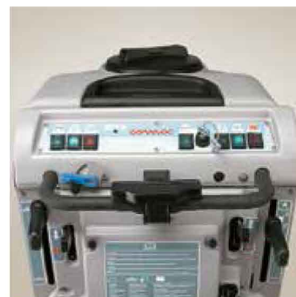
Tableau de bord lisible et intuitif, avec poignée ergonomique afin d'une meilleure manœuvrabilité de la machine